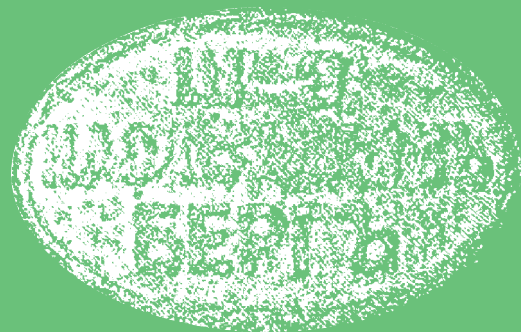
Клеймо металлургических заводов Бергов